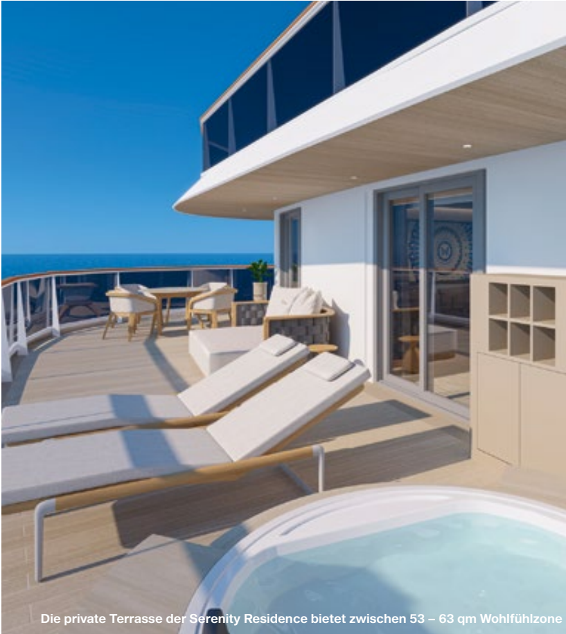
Die private Terrasse der Serenity Residence bietet zwischen 53 – 63 qm Wohlfühlzone