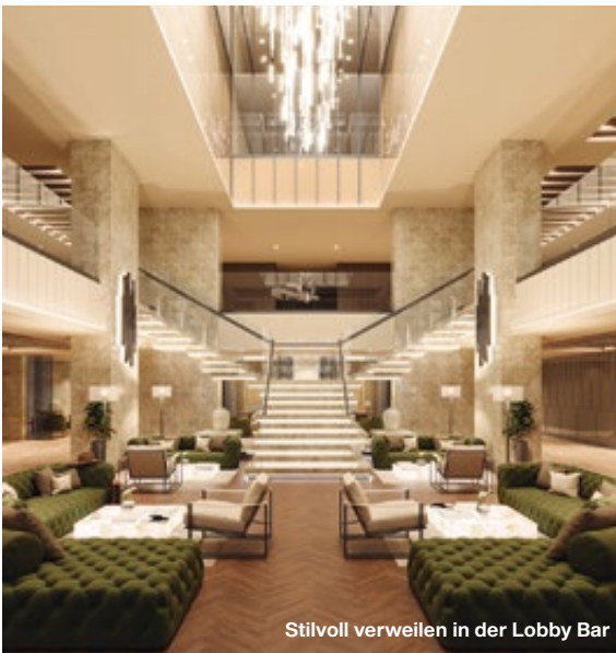
Stilvoll verweilen in der Lobby Bar