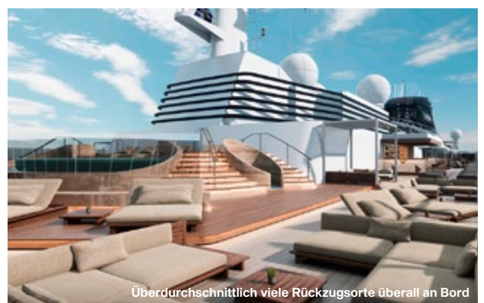
Überdurchschnittlich viele Rückzugsorte überall an Bord