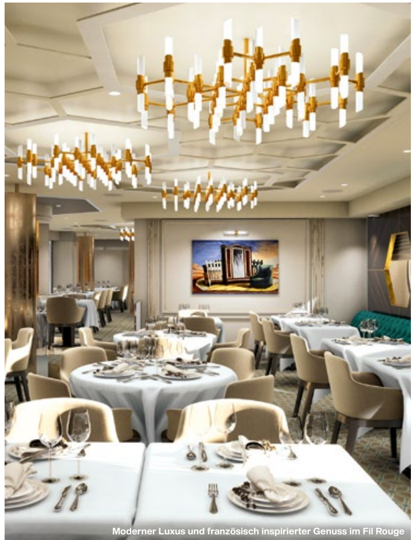
Moderner Luxus und französisch inspirierter Genuss im Fil Rouge