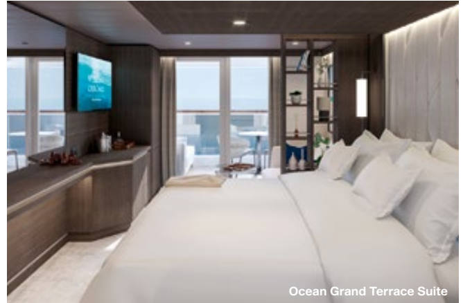
Ocean Grand Terrace Suite

Auf 56 bis 74 Quadratmetern wohnen hier zwei Erwachsene sowie ein bis zwei Kinder bis 18 Jahre oder ein dritter Erwachsener äußerst luxuriös und verwöhnt vom Butlerservice. Besonderes Ausstattungsmerkmal ist der Meerblick-Whirlpool auf der privaten Terrasse. Das Schlafzimmer ist immer separat vom Wohnbereich, vom Ess- und vom Arbeitsbe-