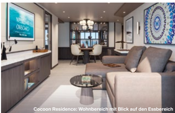
Cocoon Residence: Wohnbereich mit Blick auf den Essbereich