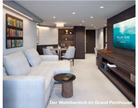
Der Wohnbereich im Grand Penthouse