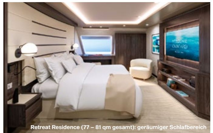
Retreat Residence (77 – 81 qm gesamt): geräumiger Schlafbereich