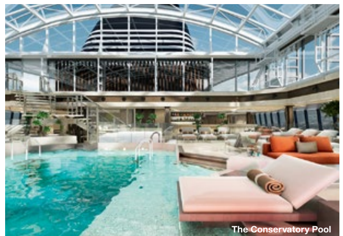
The Conservatory Pool

Es gibt außerdem drei Außenpools, davon einen adult only Pool, 64 Cabanas und einen 1.200 Quadratmeter großen Innenpool mit beweglichem Glasdach für Baden und Entspannen bei jedem Wetter, den größten und einzigen der Branche.