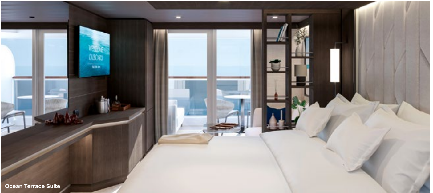
Ocean Terrace Suite

Alles, was die Welt zu bieten hat, auf sinnvolle Weise genießen. Sich mit neuen Menschen, Kulturen und Aromen und auch mit sich SELBST VERBINDEN . Sich inspirieren lassen , darum geht es Reisenden, die sich für Explora Journeys entscheiden.