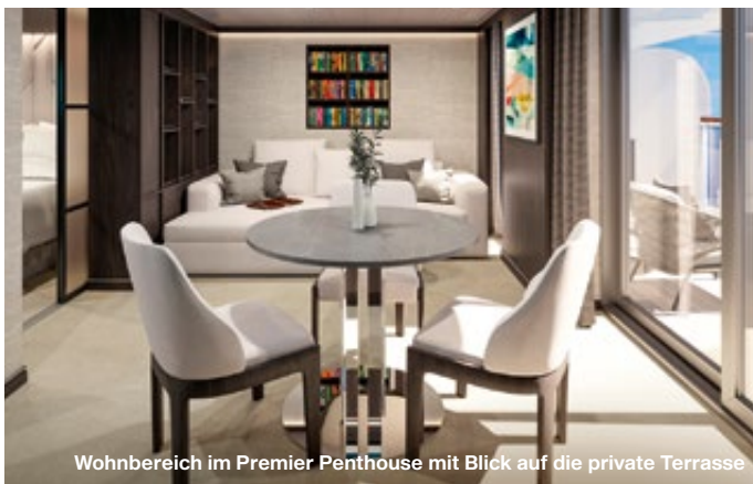
Wohnbereich im Premier Penthouse mit Blick auf die private Terrasse