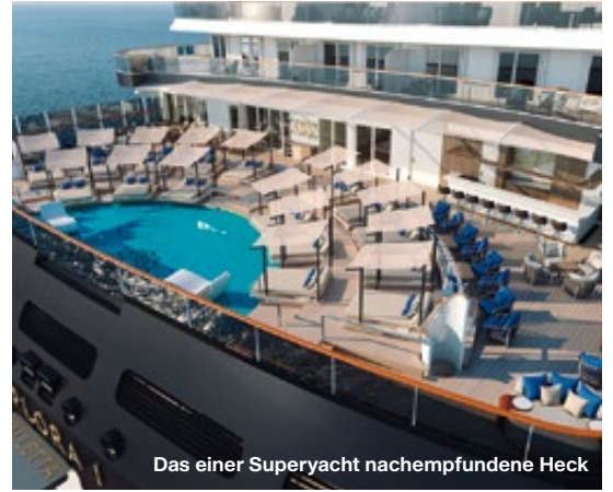
Das einer Superyacht nachempfundene Heck